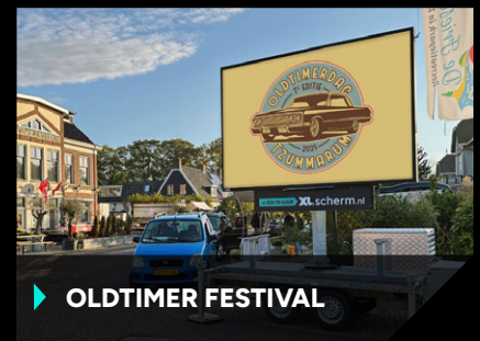
▶ OLDTIMER FESTIVAL