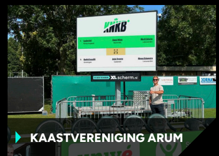
▶ KAASTVERENIGING ARUM