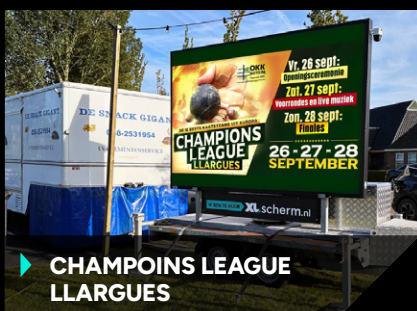
▶ CHAMPOINS LEAGUE LLARGUES