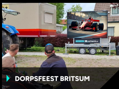
▶ DORPSFEEST BRITSUM