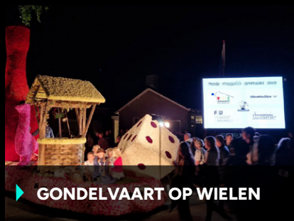
▶ GONDELVAART OP WIELEN