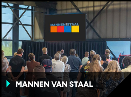
▶ MANNEN VAN STAAL