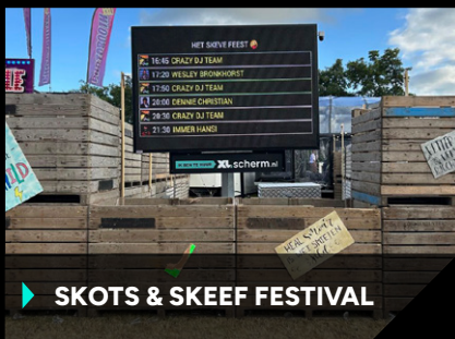
▶ SKOTS & SKEEF FESTIVAL