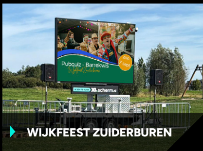
▶ WIJKFEEST ZUIDERBUREN