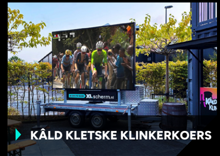
▶ KÂLD KLETSKE KLINKERKOERS