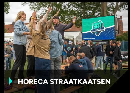
▶ HORECA STRAATKAATSEN