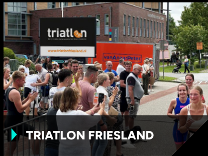
▶ TRIATLON FRIESLAND